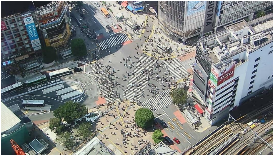
【SKY LIVE CAMERA】が映す昼間の渋谷スクランブル交差点の様子

この度「SHIBUYA SKY」は、史上初の渋谷上空から渋谷スクランブル交差点を見下ろすことができる「SKY LIVE CAMERA」のYouTubeでのLIVE配信を9月13日より開始しました。大勢の人の流れを俯瞰して見ることができる昼間の時間帯はもちろん、早朝の静かな渋谷など、リアルタイムの様子をお楽しみいただけます。「SKY LIVE CAMERA」を通して、渋谷の「今」を世界にお届けします。